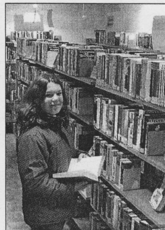
Bereits ausgezeichnet: Der Betrieb der Poppenweiler Bücherei, geführt von Ehrenamtlichen.

Die Stadt fördert mit ihrer Stiftung Projekte und Vor